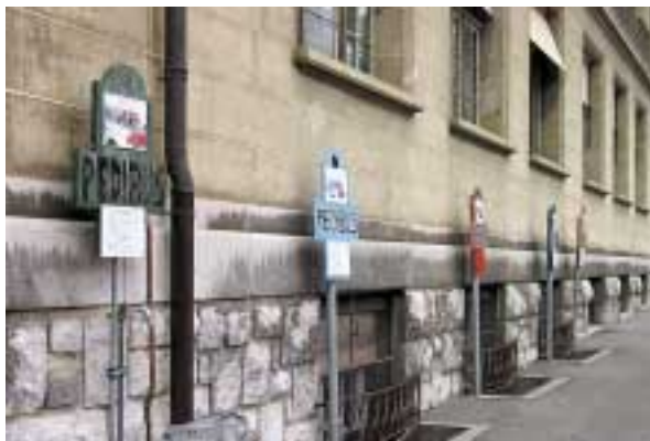
Cinq lignes d'autobus arrivent et partent de l'école de Montriond.