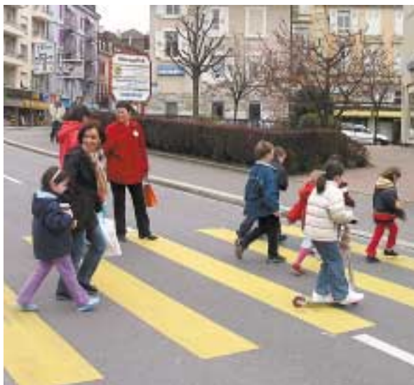
Passage d'un point dangereux.