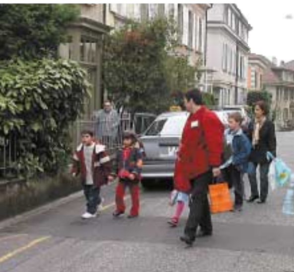
Entre deux arrêts.

« L'autobus pédestre montre qu'il est possible de mettre en place avec des moyens simples des projets qui rendent les villes plus sûres, plus agréables à vivre et qui rapprochent les gens. »