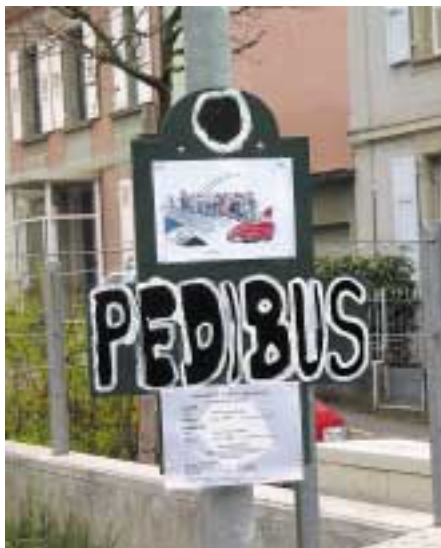
Arrêt de ligne.