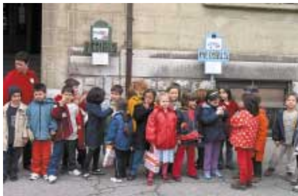
Fin de l'école. Les élèves retrouvent leur conductrice.