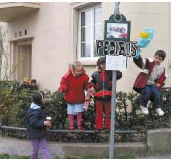
Départ de la ligne.

« L'autobus pédestre c'est très bien ! Ça protège les enfants et ça embête moins les parents pour amener leurs enfants à l'école. »